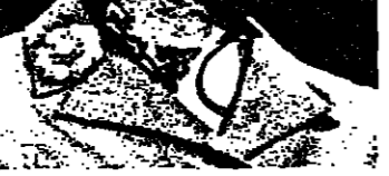
وقالها منذ زيارة الرئيس السادات للقدس في نوفمبر 1977 ، ومن ثم اتفاهات كايك نديف في سبتمبر 1978 ، وبمعاودة

وانا لا يخافني انني شك في ان اوروبا الغربية لو ساندت مسيرة السلام قلبا